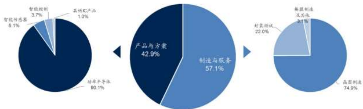
图 3：华润微 2019 年营业收入构成

公司产品与方案业务板块聚焦于功率半导体、智能传感器与智能控制领域，主要由华润华晶、重庆华微、华润矽科、华润矽威、华润半导体等子公司运营。公司是目前国内产品线最为全面的功率器件厂商，MOSFET 厂商国内营业收入最大、技术能力领先，同时在 IGBT、SBD、FRD 等功率器件上亦具有较强的产品竞争力，合计拥有 1100 余项分立器件产品与 500 余项 IC 产品。